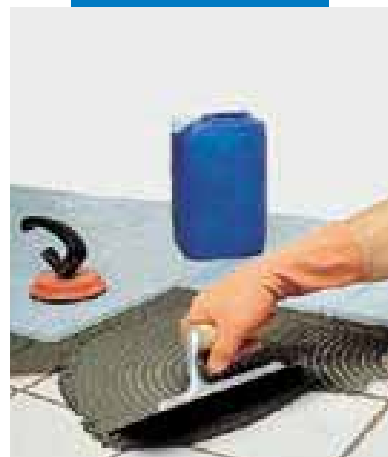
Sobreposición de aglomerado sobre cerámica existente con Granirapid gris